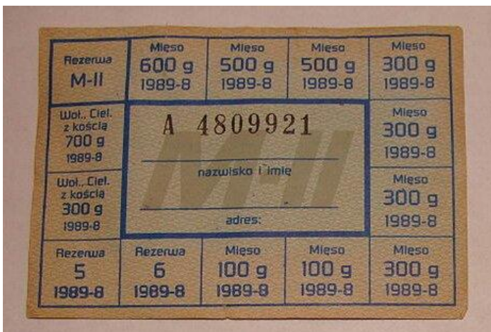
Kartki na zakup mięsa.

Braki w zaopatrzeniu były nieustannym problemem handlu okresu PRL. Aby im zaradzić, wprowadzano tzw. reglamentację. Polegała ona na sprzedaży tylko określonej liczby towarów na osobę. Kartki określały miesięczny przydział danego towaru na osobę. Gdy ktoś kupił dany towar, sprzedawczynie odcinała odpowiedni kupon z jego kartki.